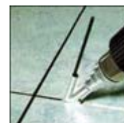
Sealing Vinyl Flooring