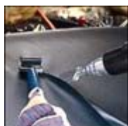
Welding Plastic Materials