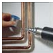
Soldering & De-soldering