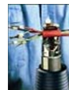
Applying Shrink Tubes