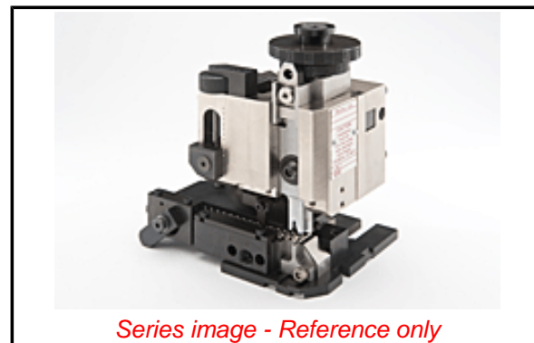
Series image - Reference only

ATS-639028100, TM-638000029, TM-638000029CN, TM-638000029DE, TM-638000029FR, TM-638000029IT, TM-638000029JP, TM-638000029KR, TM-638000029MY, TM-638000029PL, TM-638000029RU, TM-638000029SK, TM-638000029SP, TM-638000029TH, TM-638000029TW, TM-638000029VN, TM-638004900, TM-638004900CN, TM-638004900SP