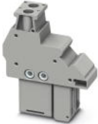
Plug, 2-pos. with integrated, automatic short circuit function

Please be informed that the data shown in this PDF Document is generated from our Online Catalog. Please find the complete data in the user's documentation. Our General Terms of Use for Downloads are valid ( http://download.phoenixcontact.com )